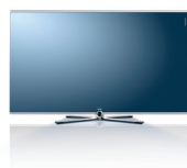
Table Stand, Revêtement chrome L 132,6/H 83,8/PP 6,0/PT 39,2

Wall Mount WM 62, Argent Chromé sans Stereospeaker : L 132,6/H 80,4 1 /PP 6,0/PT 8,5 (avec WM Flex 52 L 2 : PT max. 58,4) avec Stereospeaker : L 132,6/H 88,4 1 /PP 6,0/PT 8,5 (avec WM Flex 52 L 2 : PT max. 58,4)